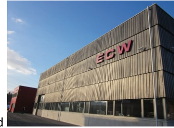
Engineering Center Wood